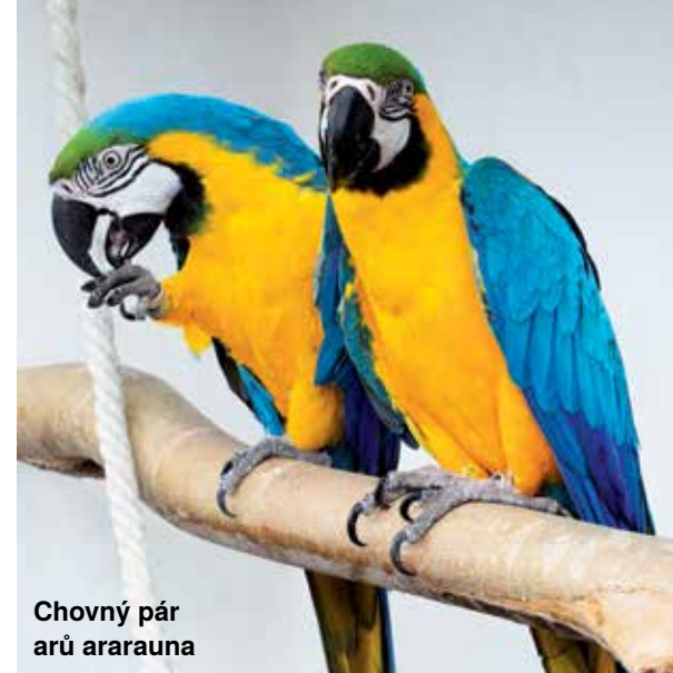
Chovný pár ararauna

Sestavení chovných párů probíhá už 25 let a ještě jsem neskončil. Začalo ještě v době dovozu a nejnovější chovné páry mám sestavené z vlastních