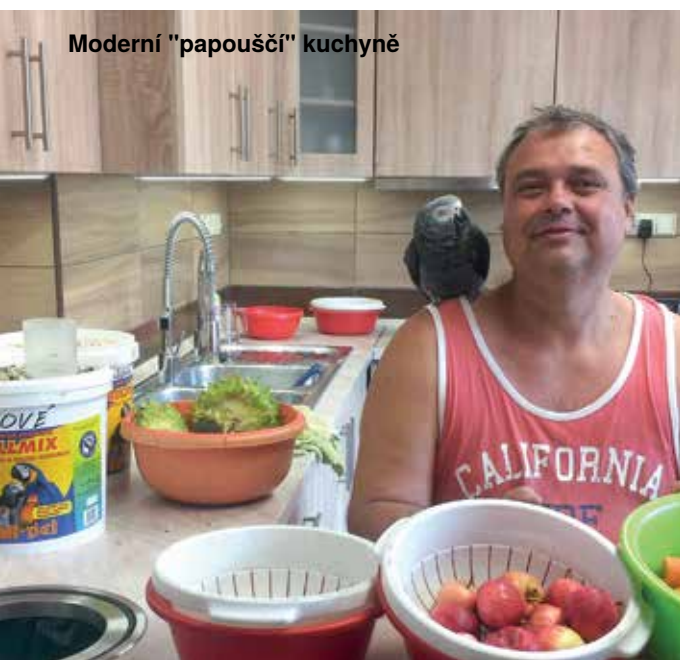
Moderní "papouščí" kuchyně

Moje chovatelské zařízení po dokončení nové části bude mít sedmáct celoročních voliér. Není to zase tak mnoho, ale rozhodně ani málo. Chovatelské zařízení by mělo splňovat jistou úroveň, aby papouškům zajistilo dobré životní podmínky a chovateli co možná nejpohodlnější obsluhu a dokonalé řízení a monitorování. Také vzhlednost a upravenost chovatelského zařízení je na místě. Technické vybavení mého chovatelského zařízení je kompletně řízeno inteligentní elektroinstalací INELS. Jde o moderní dokonalé řízení světla, topení a kamerových systémů s pomocí počítače. Rozednívání a stmívání vychází z lunárního kalendáře, vytápění v jednotlivých sekcích je individuálně nastaveno (plynové vytápění ovládané přes ventilové regulační hlavy pomocí servomotorů). Systém dále umožňuje napojení mnoha kamer v kterýchkoliv částech chovatelského zařízení atd. INELS má na starosti také zabezpečovací systém voliér a domu, osvětlení a topení domu, garáže, dvorního a zahradního osvětlení. K tomu ještě kompletně řídí provoz dvou akvarijních nádrží, ke kterým přibude další, o objemu 2000 litrů. INELS má mnohostranné využití. I když je pravda, že nejde o zrovna levnou záležitost, má výhodu stavebnicové montáže. To znamená, že lze jednotlivé části postupně pořizovat a rozšiřovat. Ohromnou výhodou INELSu je telefonní aplikace, se kterou je možné vše ovládat na dálku, přes mobilní telefon.