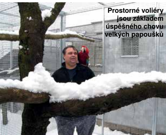
Prostorné voliéry jsou základem úspěšného chovu velkých papoušků

mohu žít a podnikat. Ale je to o tom, že musíte na sobě pořad pracovat a učit se. Je to různorodá práce. Péče o chov papoušků, dokrmování papoušků, prodeje krmiv na ptačích burzách, obchodní aktivity, provozování eshopu, on-line poradna. Třešničkou na dortu jsou přednášky, psaní článků, knih a získávání dalších informací a zkušeností. Chov papoušků je nekonečná studnice otázek a odpovědí, poznávání nových lidí a informací spojených s přírodou a životem zvířat. To mě moc baví.