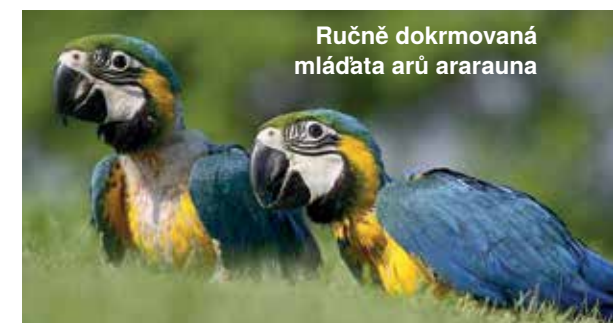
Ručně dokrmovaná mláďata ararauna

Nenakupujeme a nedokrmujeme mláďata papoušků za účelem dalšího prodeje.